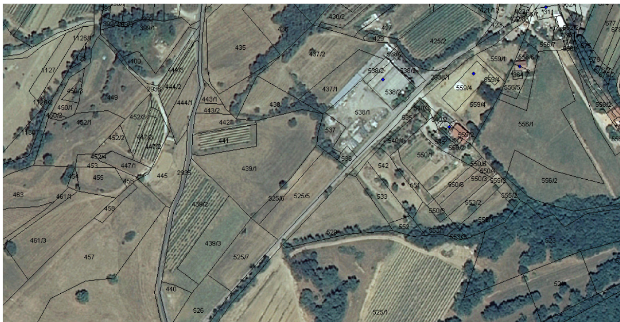
Orto foto posnetek s katastrom